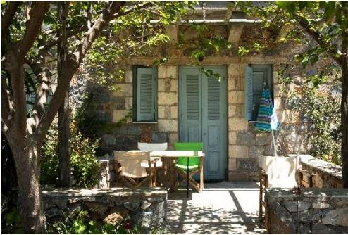
In unserer Anlage: Apartment und Terrasse

Tourismus heißt in dieser Region immer noch: Pensionstourismus und Privatzimmer. Die Mani besticht bis heute durch ihre einzigartige Landschaft, die durch das Taigetosgebirge, dessen höchster Berg fast 2500 Meter hoch ist, geprägt ist. Wilde Schluchten, einsame Bergdörfer, alte Wehrtürme und im Süden eine äußerst karge Vegetation, prägen die Mani.