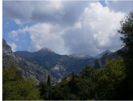
Exochori, Bergdorf im Taigetos

Die Mittagspausen können frei gestaltet werden. Die nächstgelegene Taverne ist etwa 25 Min zu Fuß entfernt, dort gibt es auch einen Kiesstrand mit Liegen und Schirmen.