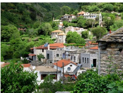
Kastania, Bergdorf in der Nähe von Agios Dimitrios

An einem Seminartag entfällt die Abendeinheit