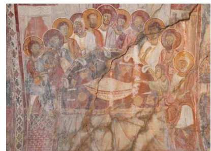
Fresken aus dem 15. Jh. in einer Kirche