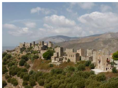
Vatia, typisches maniotisches Wehrdorf